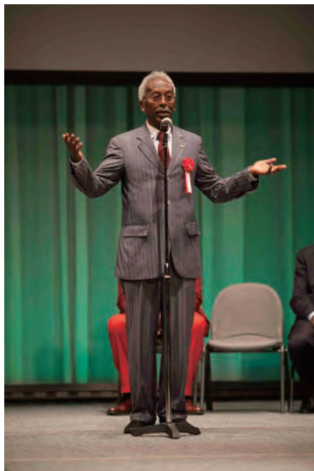
◀ ADC 在日本アフリカ外交団副理事 ジブチ共和国駐日大使 ジブチ共和国大使館全権特命大使 アホメド・アライタ・アリ閣下